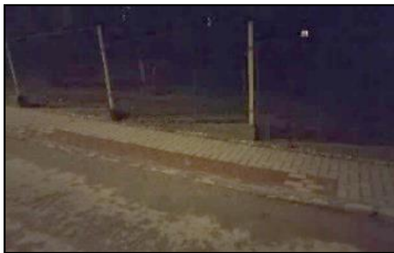
Obrázek 2: Nikam nevedoucí nájezd pro auta