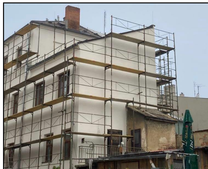
Obrázek 5: Neomítnutý přístavek a rozbité dveře