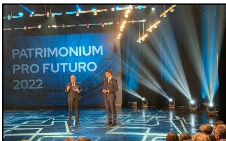
Obrázek 6: Předávání cen za Skrytý středověk