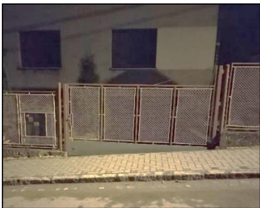
Obrázek 3: Chybějící vjezd do garáže