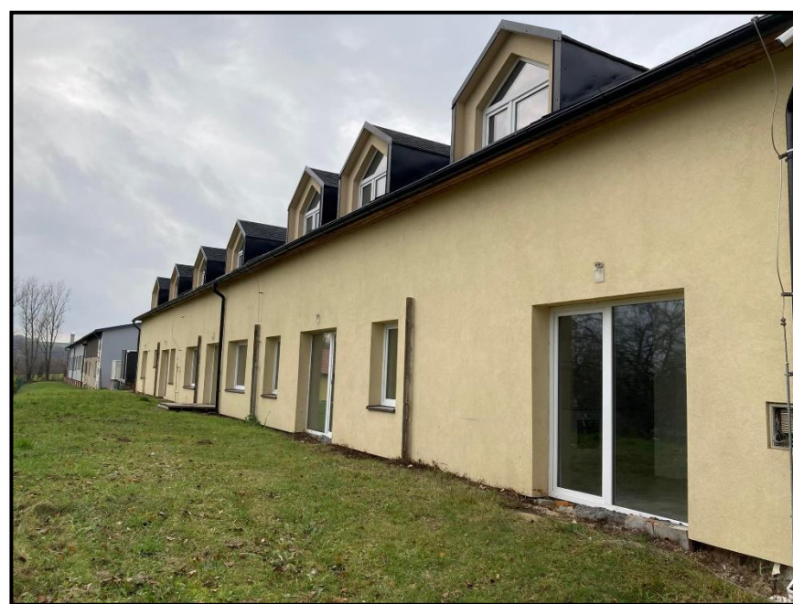
Obrázek 4: Opravený bytový dům na Radotínské ulici, čekající na připojení na kanalizaci